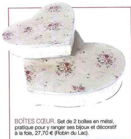
BOÎTES CŒUR. Set de 2 boîtes en métal, pratique pour y ranger ses bijoux et décoratif à la fois, 27,70 € (Robin du Lac).