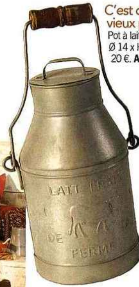
C'est dans les vieux pots... Pot à lait en tôle. Ø 14 x H 27 cm, 20 €. Antic Line.