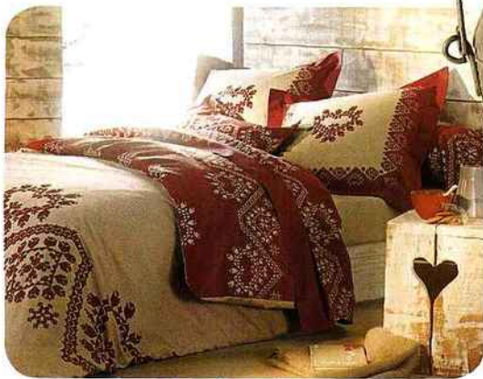
Sous la couette Parure de lit en toile de coton imprimé double face. Housse de couette 240 x 220 cm, 69,90 € et taie 63 x 63 cm, 16,90 €. "Vicky", Becquet.