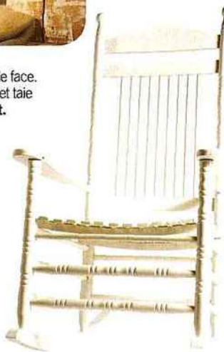
Berceuse Chaise à bascule en chêne recouvert de vernis polyuréthane blanc ou bleu. L 68,5 x P 86,5 x H 120 cm, 49 €. "Siesta", La Maison de Valérie.