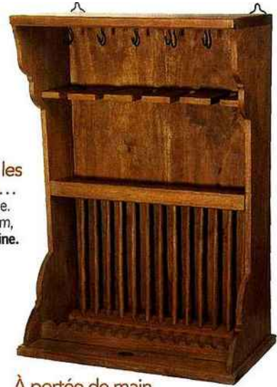
À portée de main Vaisselier mural en bois. L 50 x P 29 x H 73 cm, 220 €. Comptoir de Famille.