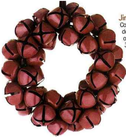
Jingle bells Couronne de grelots décoratifs en fer terni ou prune. Ø 25 cm, 30 €. "Méribel", Habitat.