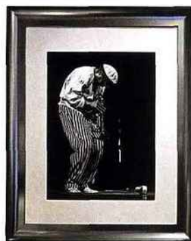
Photo encadrée, cadre platine. À partir de 239 € (30 x 40 cm). La Photofactory